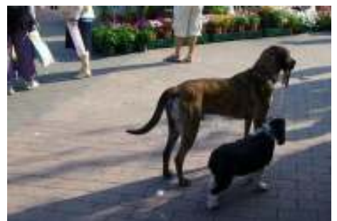
Vu par Gérard Garson