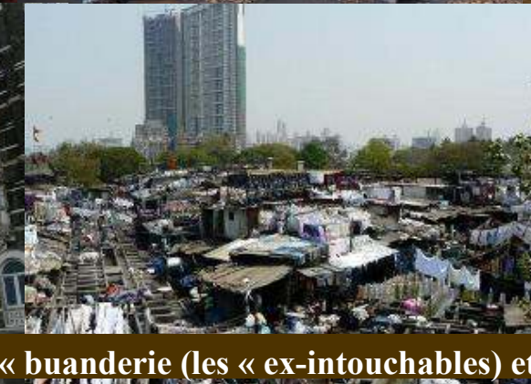
Mumbaï : le luxe, la « buanderie (les « ex-intouchables) et Gandhi...