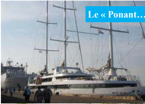
Le « Ponant... sous voiles