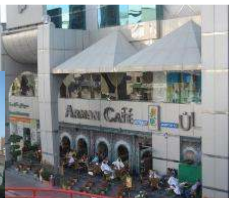
Un (rare) petit coin sympa

Des millions de dollars et des problèmes de voisinage