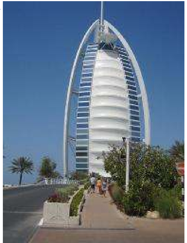
le seul hôtel 6 *